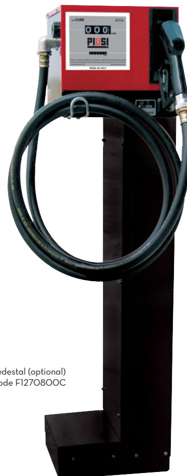
Pedestal (optional) Code F1270800C