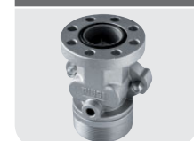
with integrated valve Code F17163000