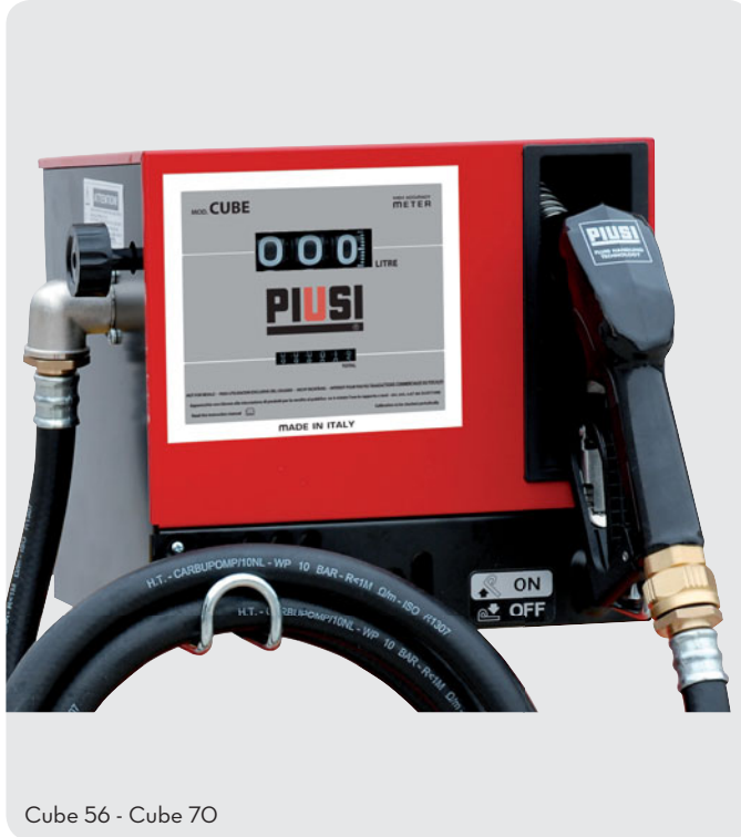
Cube 56 - Cube 70