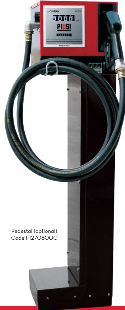
Pedestal (optional) Code F1270800C