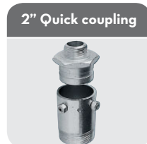
2" Quick coupling