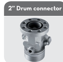
2" Drum connector