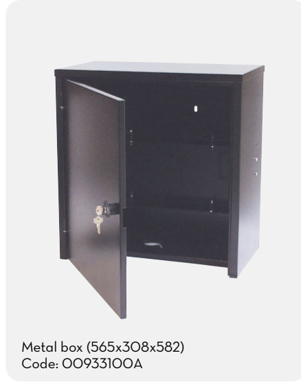
Metal box (565x308x582) Code: 00933100A