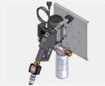
ST Panther72 Filter + K24 meter