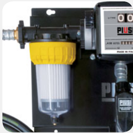
Available with Clear Captor Filter