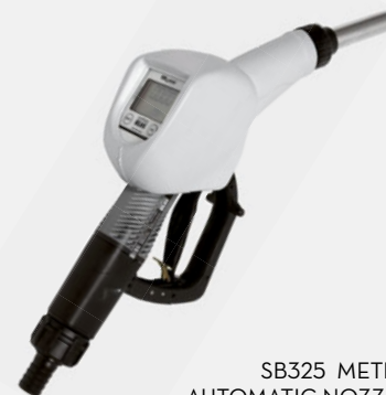
SB325 METER AUTOMATIC NOZZLE