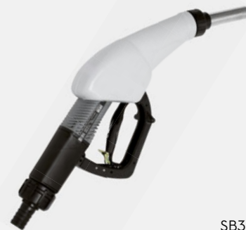
SB325 AUTOMATIC NOZZLE