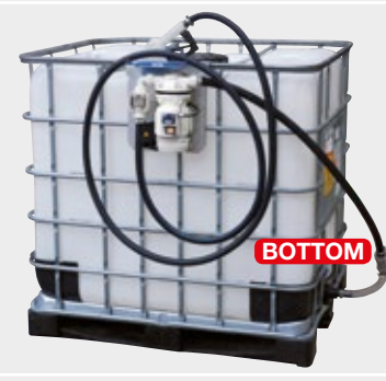
SUZZARABLU EXTERNAL SUCTION