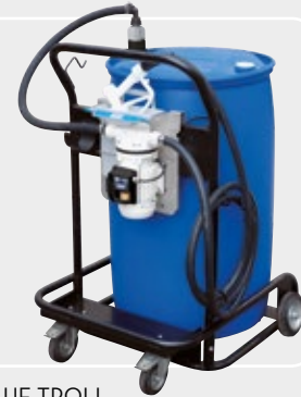
SUZZARABLU TROLL (SIDE + TROLL Code R12068010 + DIP TUBE Code F15606000)