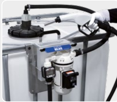
SUZZARABLU PRO (K24+SB325 nozzle)