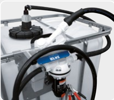
SUZZARABLU BASIC 12V