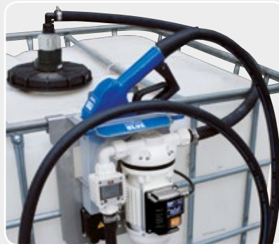
SUZZARABLU PRO (K24+A60 inox nozzle)