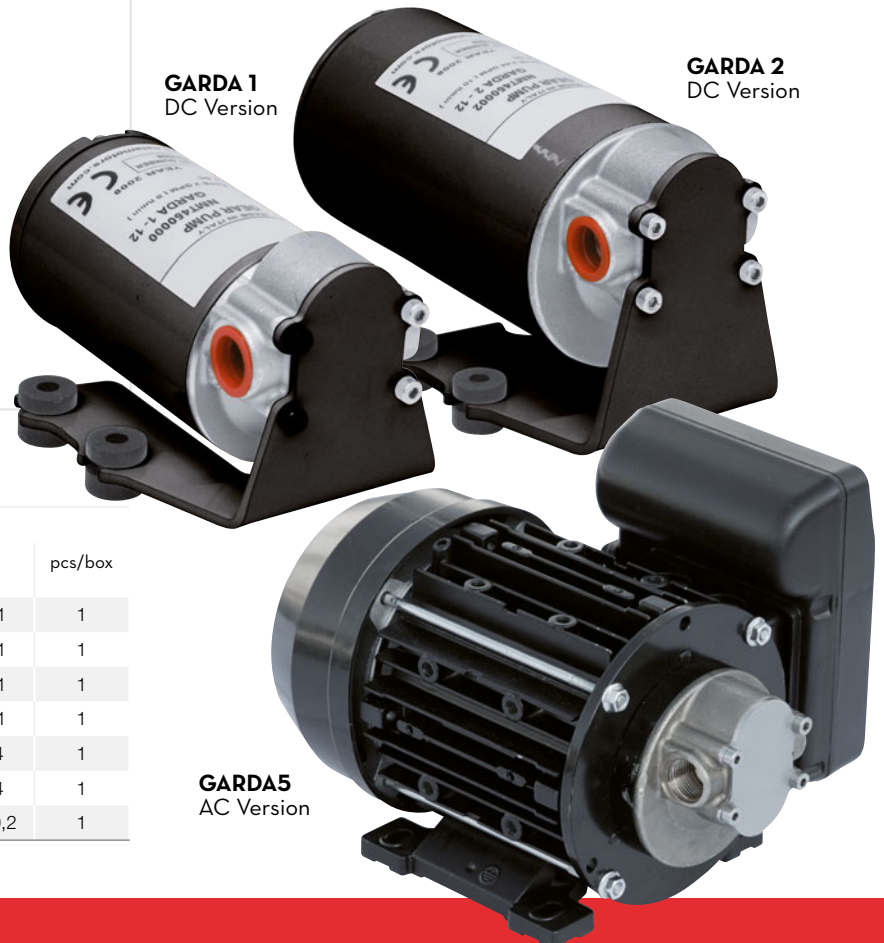
GARDA 2 DC Version