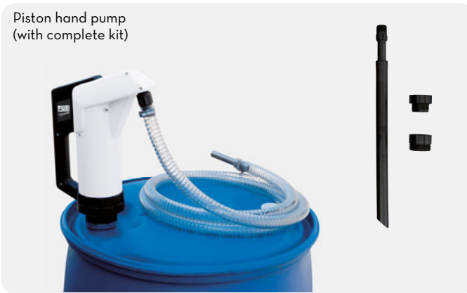
Piston hand pump (with complete kit)