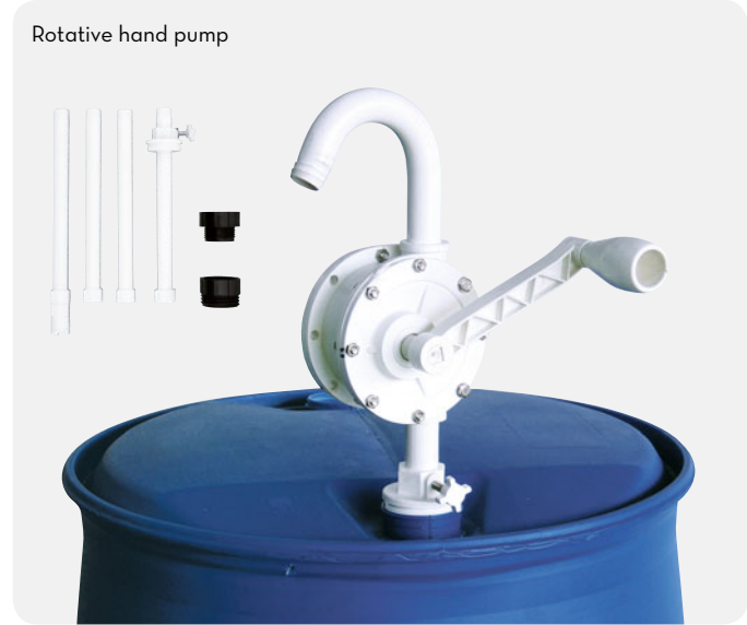
Rotative hand pump