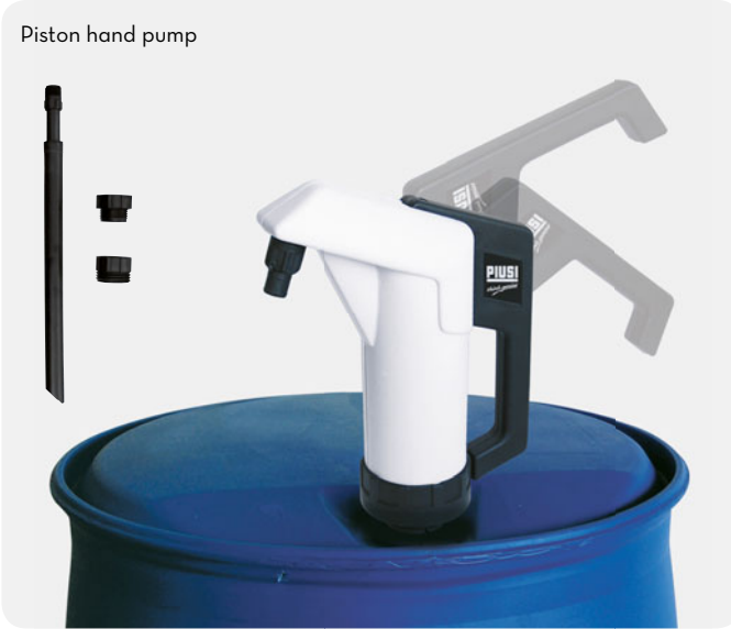
Piston hand pump