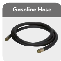
Code F1815100A (4 mt 3/4")