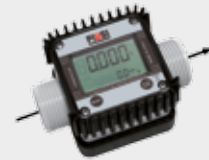
K24 ENO approved for wine and beer (on request)