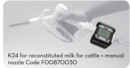
K24 for reconstituted milk for cattle + manual nozzle Code F00870030