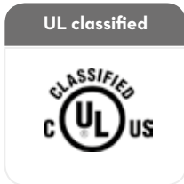
Class I Groups C and D