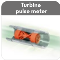
Turbine pulse meter