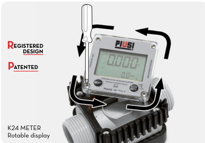
K24 METER Rotable display