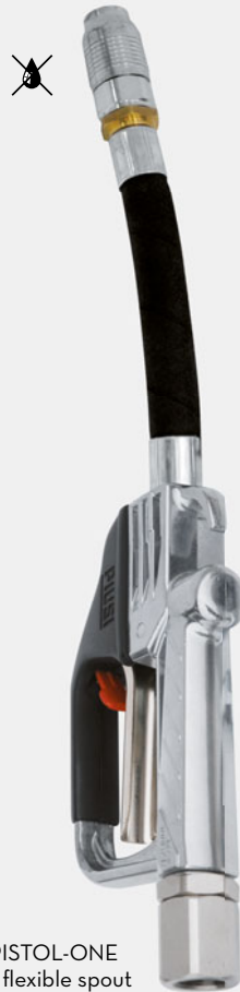
PISTOL-ONE + flexible spout