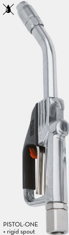
PISTOL-ONE + rigid spout