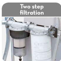
Two step filtration